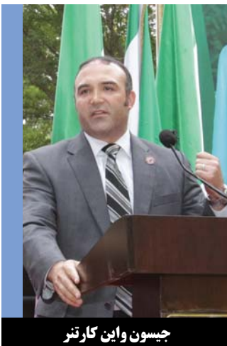
جسیون واین کارتیر