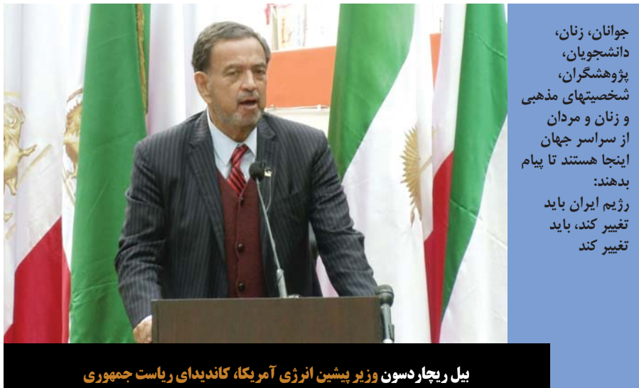
بیل ریچاردسون وزیر پیشین انرژی آمریکا، کاندیدی ریاست جمهوری