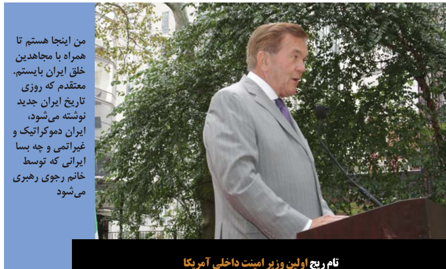
تام ریچ اولین وزیر امنیت داخلی آمریکا

اکنون سؤال این است که چرا این کار را کرده‌اند؟ ما نظرم او این کار را کرد چون درک می‌کنند آن چه امروز آمریکا انجام می‌دهد به‌طور واقعی یک جرم است. این چه جرمی است؟ این جرم، که همه شما با آن آشنا هستید و همه ما به آن دروغ نسبت به ارتکاب آن متهم شده‌ایم. این جرم تأمین کمکهای مادی به تروریسم است و این قرارداد چه می‌کند؟ دهها میلیارد می‌شاید صدها میلیارد دلار کمکهای مادی برای تروریسم تأمین می‌کند. هر دلازی که رژیم ایران دریافت می‌کند، بسیاری از آن جهت سرکوب مخالفان در داخل ایران استفاده خواهد شد و بقیه آن جهت تشویق تروریسم در سراسر خاورمیانه و در نهایت در سراسر جهان صرف خواهد شد. رئیس‌جمهور آمریکا و وزیر دفاع دوستان من هستند، من اینجا حزبی برخوردار نمی‌کنم، من یک دموکرات لیبرال هستم که دو نوبت از اوامها حمایت کرد. اما از یک دیدگاه دموکرات لیبرال نسبت به این قرارداد مخالف هستم. وقتی رئیس‌جمهور این حرف را می‌زند که