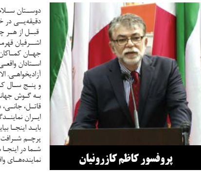
پروفسور کاظم کاروبیان

درد بر شما، خسته نباشید. واقعا وقتی شما را می بینم افتخار می کنم که ایرانی هستم، چون شما نوادگان راستین قهرمانان ملی ما هستید، از بدو تاریخ ایران تا حالا که در این سی و شش سال ساکت ننشستید، به نام ایران و به نام آزادی، هممیهنان عزیز، امروز آخوند شیاد، روحانی یا کارنامه ۱۲۰۰۰ اعدام در دو سال، در نشست مجمع عمومی ملل متحد شرکت می کند. او و رژیم جنایتکار آخوندها به هیچ وجه مردم ایران را نمایندگی نمی کنند. او فقط نماینده دولتی است که در ۳۶ سال گذشته به قتل و غارت مردم مظلوم ایران و بی حرمتی به ناموس آنها پرداخته است. اموال آنها را به بنما برده و میلیاردها دلار سرمایه های ملی را صرف نهدای سرکوبگر صدور تروریسم و برنامه اتمی و دخالت و حمایت از دیکتاتورها در عراق و سوریه کرده است. روحانی و ولی فقیهش، خامنه ای که نه تنها قاتل مردم ایران بلکه نابودکننده