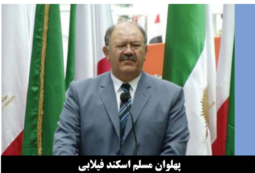
پهلوان مسلم اسکند فیلابی

هممیهنان گرامی، مردم ما در داخل ایران واقعا زیر شدیدترین فشارها هستند و ما در خارج از ایران باید صدای مظلومیت هممیهنانمان در داخل کشور را بشنیم. استقلال و آزادی، زحمت و انرژی و اراده و استواری زیادی می طلبید که شما مردم ایران طی سالها با نثار جان و مال و تحمل آوارگی و ساکت نشدن در برابر رژیم انجام داده اید. این حرکت را باید تا برانندازی کامل این جانیمان ادامه دهیم. ما باید کمر همت بندیم و دست در دست هم