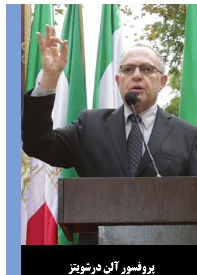
پروفسور آلن درشویز