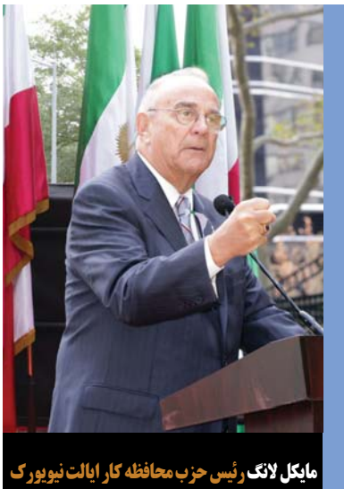
مایکل لاک رئیس حزب محافظه کار ایالت نیویورک

جوانان، زنان، دانشجویان، پژوهشگران، شخصیت‌های مذهبی و زنان و مردان از سراسر جهان اینجا هستند تا پیام بدهند: رژیم ایران باید تغییر کند، باید تغییر کند