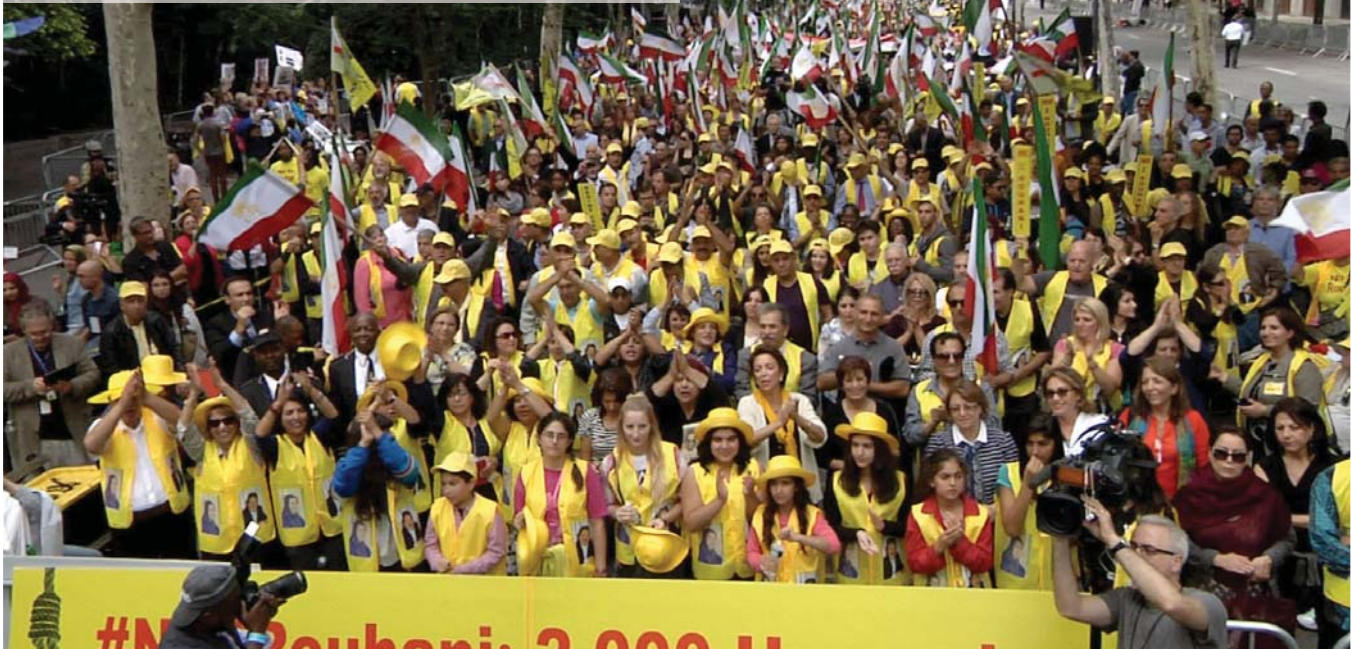
نیویورک - دوشنبه ششم مهرماه ۹۴ - تظاهرات ایرانیان آزاده در اعتراض به حضور آخوند حسن روحانی در مقر سازمان ملل متحد

فاکس نیوز: مریم رجوی می گوید سران رژیم آخوندی به جای سخنرانی در ملل متحد باید به خاطر جنایت علیه بشریت محاکمه شوند